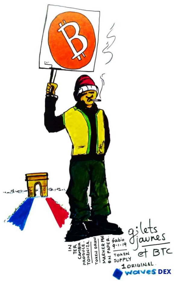
Gilets Jaunes et btc por Fabio Lopera